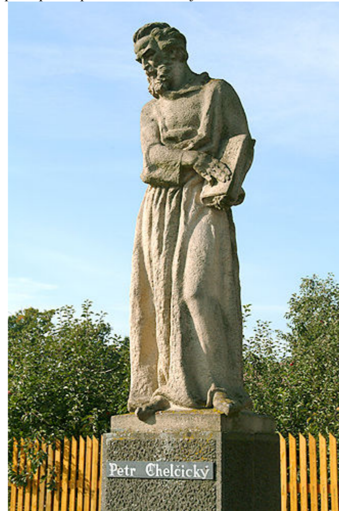
Socha Petra Chelčického v Chelčiciach

Iní historici ho podľa rôznych teórií považovali za nevoľníka, šľachtica, obuvníka alebo kňaza. Jeho základná znalosť latiny a čas, ktorý mohol venovať písaniu svojich 56 zatiaľ známych spisov (stále sa objavujú nové) nahrávajú hypotéze o tom, že bol príslušníkom nižšej vidieckej šľachty, zemanom s prístupom k pomerne rozsiahlej knižnici.