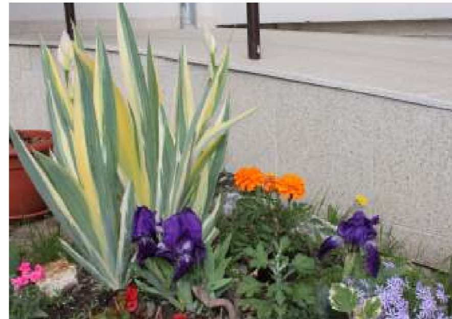
Jarné zátišie pred kostolom

Tentoraz sme pripravili úlohy pre deti do 10 rokov.