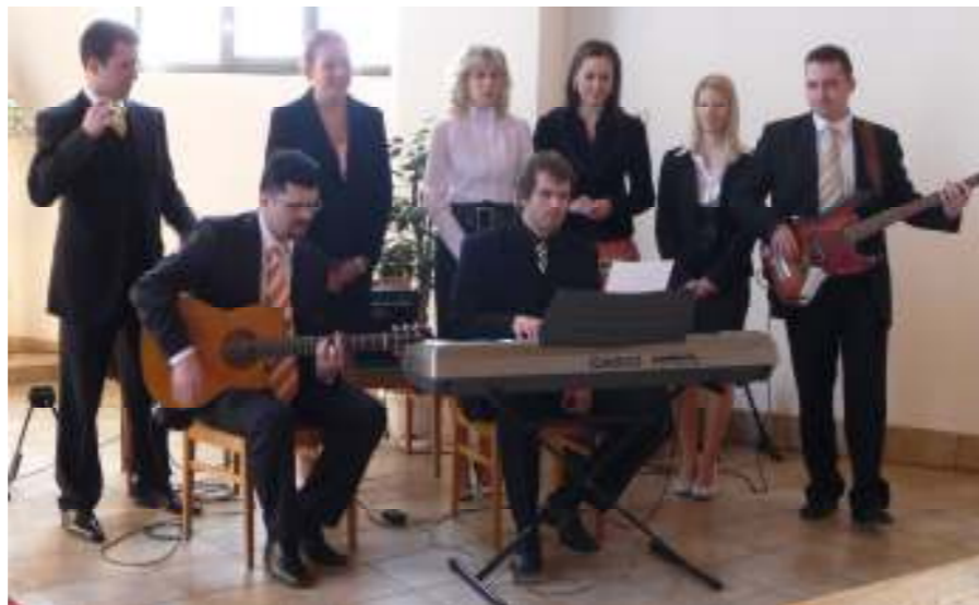
Veľkonočné vystúpenie skupiny Rogate

Na Božiu slávu vystúpili deti, mládež, spevokol a hudobná kresťanská skupina Rogáte. Chcem poďakovať všetkým, ktorí sa akýmkoľvek spôsobom podieľali na veľkonočnom programe.