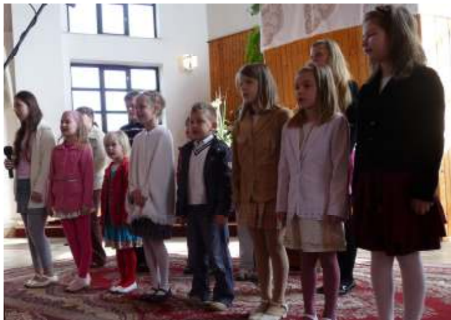
Veľkonočné vystúpenie detí

Veľkonočná nedeľa 4.4.2010 bola v znamení speváckych vystúpení počas dopoludňajších bohoslužieb.