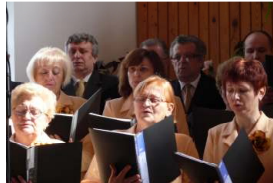
Veľkonočné vystúpenie spevokolu

Dlhosť dní leží v jej pravici, a jej ľavica bohatstvo a sláva.