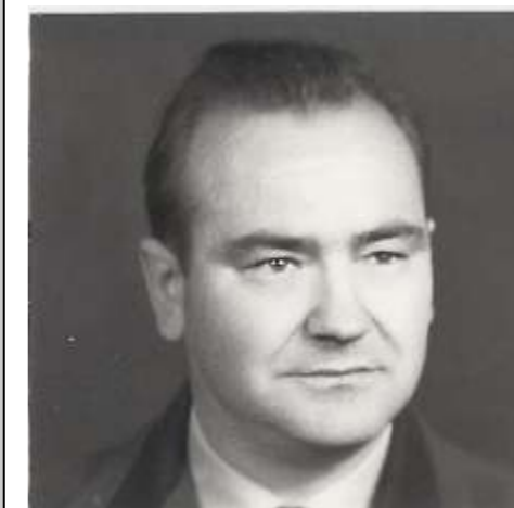
Ján Knežo foto: Archív

Svätodušné evanjelium je zvestou o naplnení zaslúbení zoslania Ducha Svätého na apoštolov Pána Ježiša Krista na židovské Letnice v Jeruzaleme a zrodenie prvého spoločenstva veriacich, ako aj začiatok víťazného prenikania Kristovho evanjelia do celého sveta. Kresťanská cirkev sa zrodila z tejto udalosti, daru mocného a pozhnaného pôsobenia