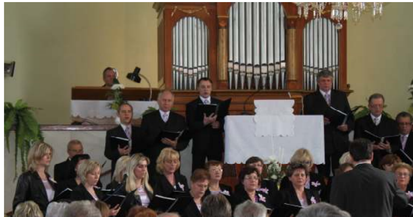
Vystúpenie spevokolu na stretnutí spevokolov v ref. kostole v Trhovišti

Vďaka Bohu za spoločne prežitú Veľkú noc! Za chlieb a víno Svätej večere Pánovej, v ktorej sa nám dostalo nového uistenia. Za obohatenie milosťou, ktorou sme spasení.