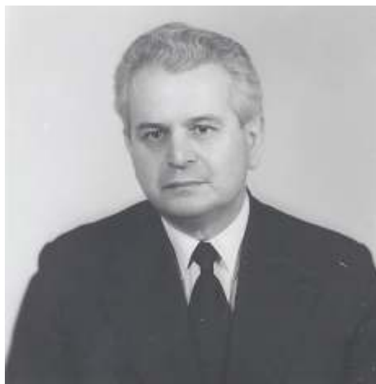
Michal Hromaník

Text: Rím 4, 25: „Ktorý bol vydaný pre naše hriechy a vstal z mŕtvych pre naše ospravedlnenie.“